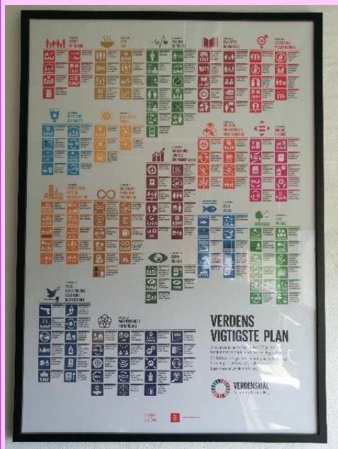
Kuva 9. Kestävä kehityksen tavoitteet EUC Syd:ssä

Tämän Train2Sustain-projektiryhmän kumppaniorganisaatiot pyrkivät myös varmistamaan, että kestävä kehitys tavoitteet saavutetaan. Yksi esimerkki on tanskalainen oppilaitos EUC Syd. Kuvasta 9 löydät lisätietoja siitä, miten he integroivat 17 kestävä kehityksen tavoitetta toimintaansa: https://www.eucsyd.dk/verdensmaal/